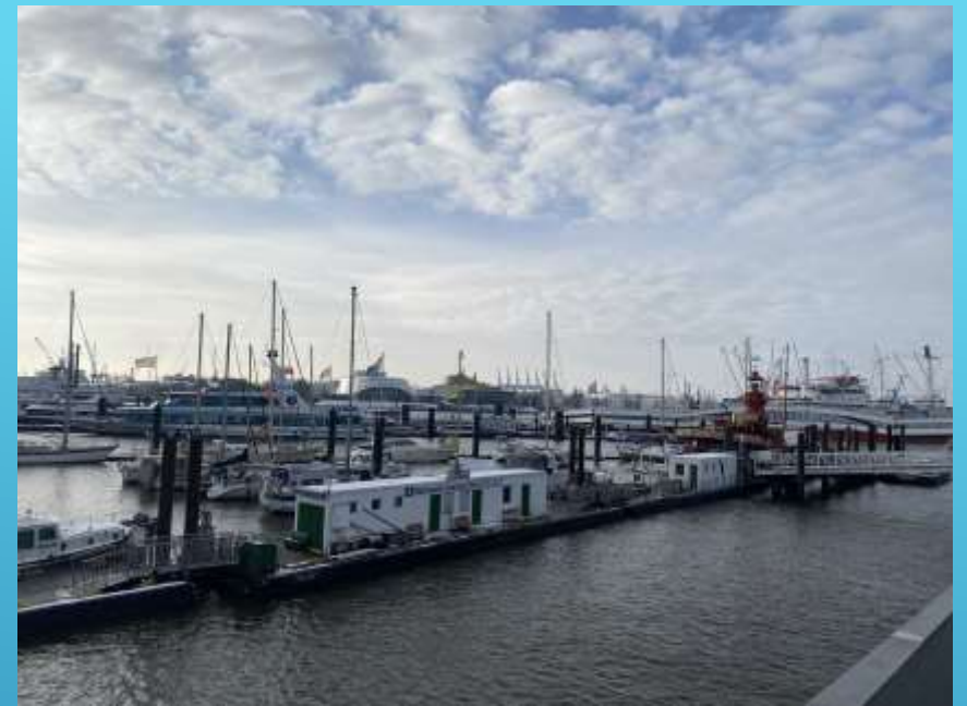
A kikötő és környéke