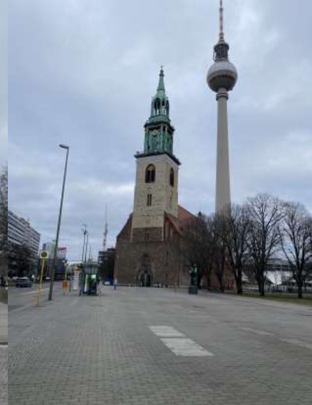
Az NDK és az NSZK két jelképes építménye